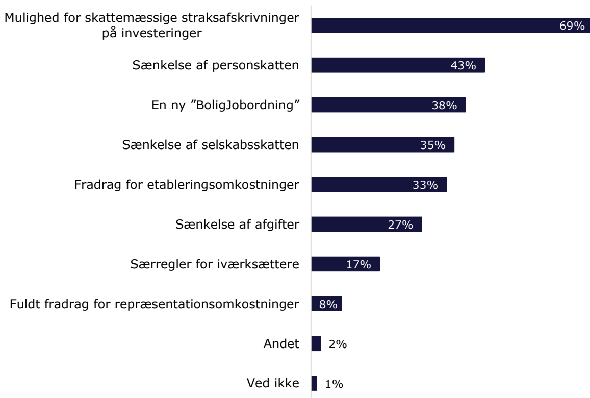
Figur 3: Hvilke værktøjer i skatteloven vil efter din opfattelse kunne motivere virksomhederne til at foretage flere investeringer? (n=213)