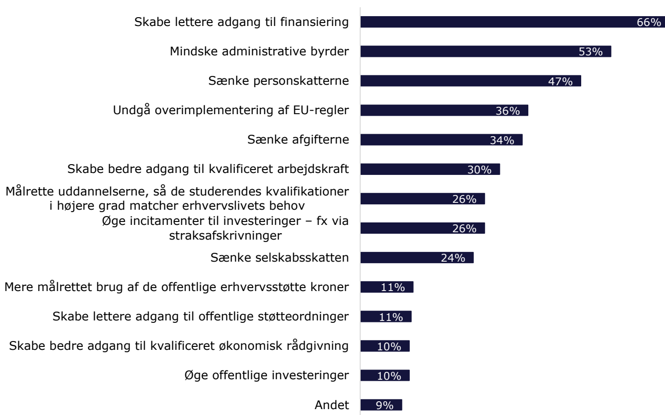
Figur 1: Hvad skal en ny regering uanset farve efter din vurdering gøre for at styrke væksten i virksomhederne på kort sigt 6-12 måneder? (Angiv gerne flere svar) (n=248)

På tredjepladsen i revisorerens liste ligger muligheden for at skabe vækst på kort sigt ved at sænke personskatterne. Her er det værd at bemærke, at områder som lavere afgifter og den i valgkampen meget omtalte selskabsskat prioriteres lavere som vækstdrivere af revisorerne.